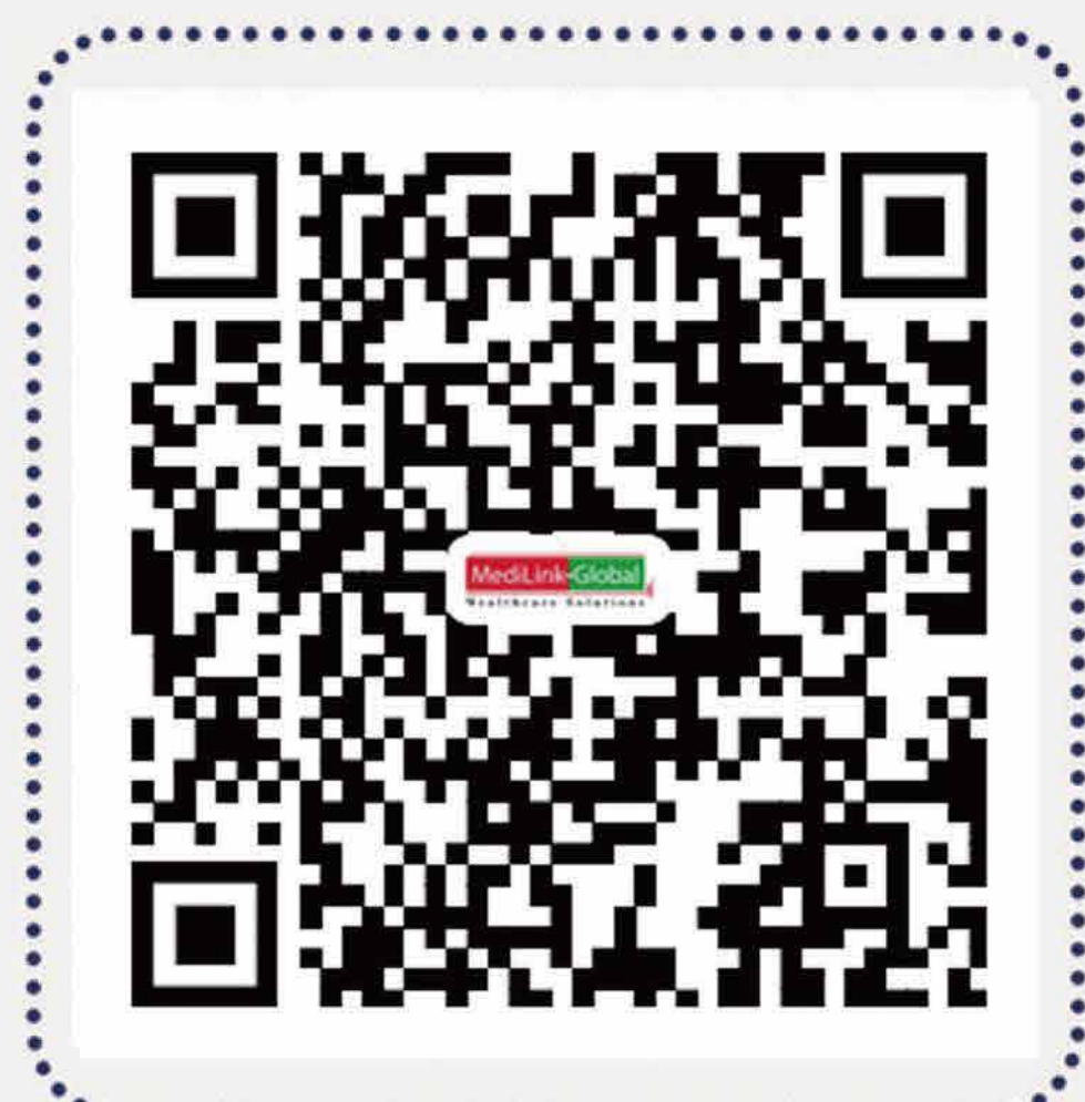
中间带网络医疗机构清单