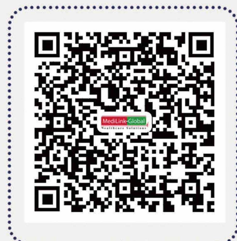
除外医疗机构/医生清单